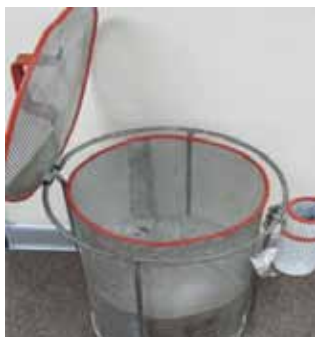
Агаар шүүгч ашигласан хогийн сав