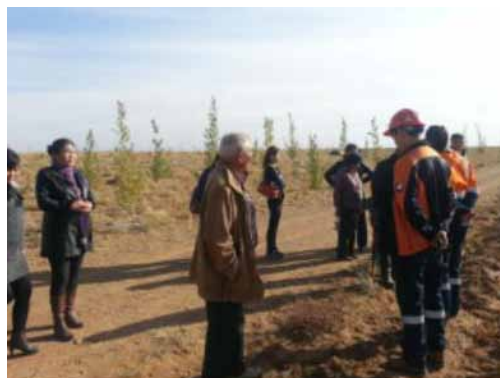
Хяналт үнэлгээний ажилд иргэдийг оролцуулж буй байдал