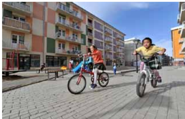
“Цэций” орон сууцны хорооллын гадаад харагдах байдал, тоглоомын талбайн хэсгээс