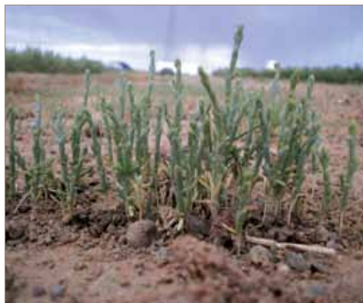
Туршилтын талбайд тарьсан 1 настай заг

Тарилтыг хийхдээ дээр өгүүлсэн ганд тэсвэртэй нутгийн унаган улаан бор бударгана, орог тэсэг, хармаг, хотир, говийн хялгана, гялгар дэрс зэрэг ургамлууд болон ургах боломжтой саман ерхөг, соргүй согоовор, дагуур өлөнгө зэрэг ургамлуудыг тарьсан.