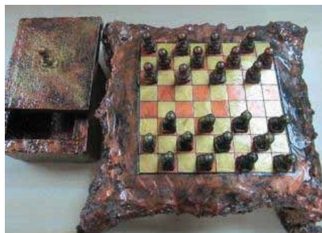
Хаягдал төмөр болон хөөсөнцөр ашигласан даам, хөлгийн хамт