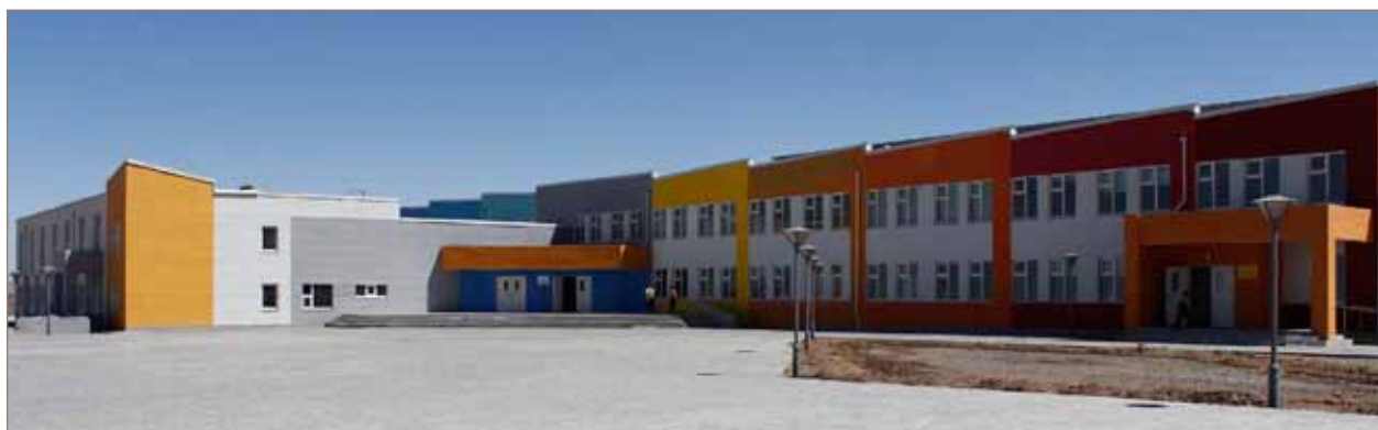
“Мөрөөдөл” цогцолборын гадаад харагдах байдал

Энэхүү цогцолбор нь сургалтын орчин үеийн стандартыг нэвтрүүлсэн, архитектурын өвөрмөц шийдэл бүхий нэгдмэл төлөвлөлттэй гэдгээрээ онцлог юм. Тус цогцолборыг орон нутагт хүлээлгэн өгөх ба улсын статустай Цогтцэций сумын 6-р сургууль, 7-р цэцэрлэг үйл ажиллагаагаа амжилттай эхлээд байна. Түүнчлэн компанийн зүгээс уг цогцолборын гадаад, дотоод орчны тохижилт, тоног төхөөрөмж нь хүүхдийн эрүүл, аюулгүй орчинд сурч, хүмүүжих бүхий л нөхцлийг бүрэн хангасан байхад шаардлагатай тоног төхөөрөмж суурилуулахад хөрөнгө оруулалт хийсэн төдийгүй, цогцолбор нь цаашид орон нутгийн боловсролын чанар, хүртээмжийг нэмэгдүүлэхэд хувь нэмрээ оруулах боловсролын жишиг сургалтын хөтөлбөр, стандартыг хангасан сургалтын менежментийг нэвтрүүлэх “хөтөлбөр” хэрэгжүүлэх бөгөөд зардлыг компани бүрэн хариуцан ажиллах юм.